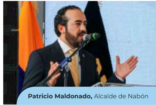
Patricio Maldonado , Alcalde de Nabón

El GADM Nabón destacó como la internacionalización de su municipio les ha permitido atraer fondos internacionales para proyectos de infraestructura y desarrollo económico. A través de alianzas y formar parte de redes internacionales como Mercociudades. Además esto ha permitido la gestión de recursos no reembolsables y/o asistencias Técnicas como: • Asistencia técnica CAF – Estudios planta de agua potable del Centro Cantonal • Donación ambulancia ABJ • Postulación Embajada de Japón – Fondos APC • Capacitación y fortalecimiento institucional • Voluntariado internacional.