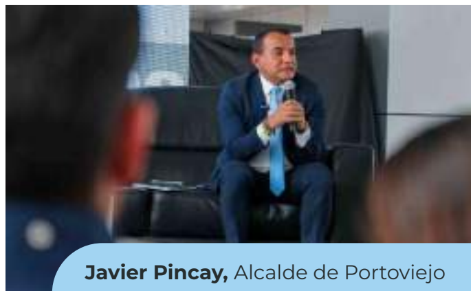
Javier Pincay , Alcalde de Portoviejo

GADM Portoviejo presentó sus avances en la implementación de una ciudad inteligente , destacando como la cooperación internacional ha sido crucial para financiar tecnologías que mejoren la gestión urbana y la calidad de vida de sus ciudadanos, tales como sistemas de semafORIZACIÓN inteligentes y la integración de tecnologías para mejorar la seguridad ciudadana.